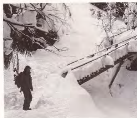
Údolí Bílé Opavy je jednou z nejnavštěvovanějších lokalit v CHKO Jeseníky. V zimě tudy i přes obtížné turistické podmínky prochází kolem 2 tisíc lidí.